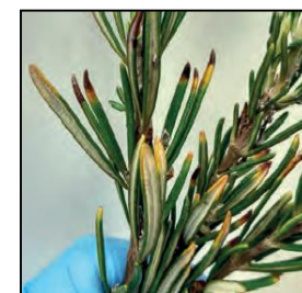
Rosmaninho, MAPA, Espanha