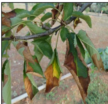
Cerejeira, Donato Boscia, Itália