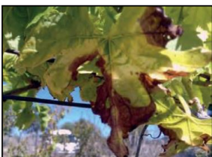
Videira, MAPA, Espanha