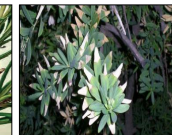
Polígala, MAF, França