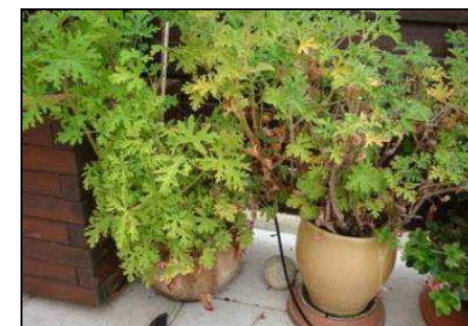
Pelargónio, MAF, França