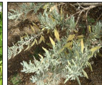
Lavanda, MAF, França