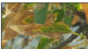
Amendoeira, MAPA, Espanha