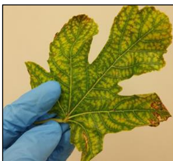
Figueira, MAPA, Espanha